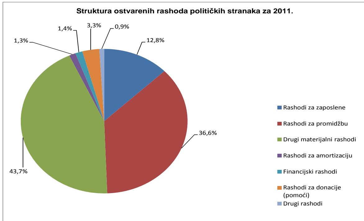
Grafički prikaz broj 2

Drugi materijalni rashodi ostvareni u iznosu 72.411.420,00 kn se odnose na rashode za uredski materijal, energiju, naknade troškova službenog puta, usluge telekomunikacija, pošte i prijevoza, komunalne usluge, te usluge zakupa i najma poslovnog prostora i opreme.